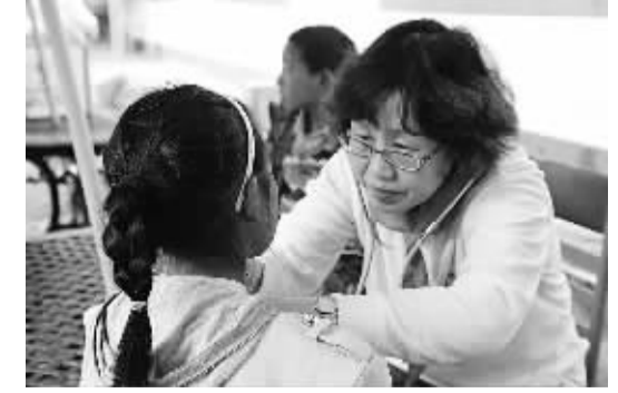
北京的医生为儿童进行义诊。