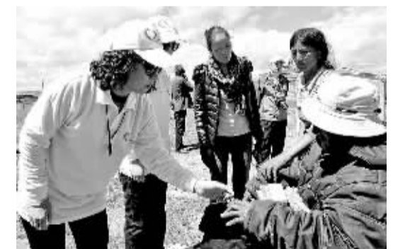
医疗调研团为牧民送去药品。

“同心·共铸中国心”是以老少边穷地区心脑血管疾病救助救治和健康关爱为核心的大规模定点、定向的主题公益活动。自2008年开展以来先后对四川、宁夏、山东、内蒙古、西藏、青海等地的百姓进行了大规模的健康志愿服务。至今已有20余万群众受益。