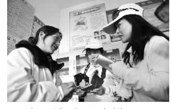
医疗调研团在卫生院调研相关情况。