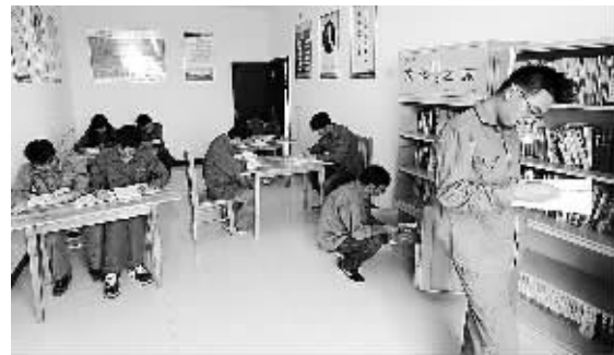
日前，湖北松滋南至荆州南220千伏输电线路工程施工人员在工地图书室阅读书籍。国网湖北电力公司工会创建的“书香工地”深受施工人员欢迎。