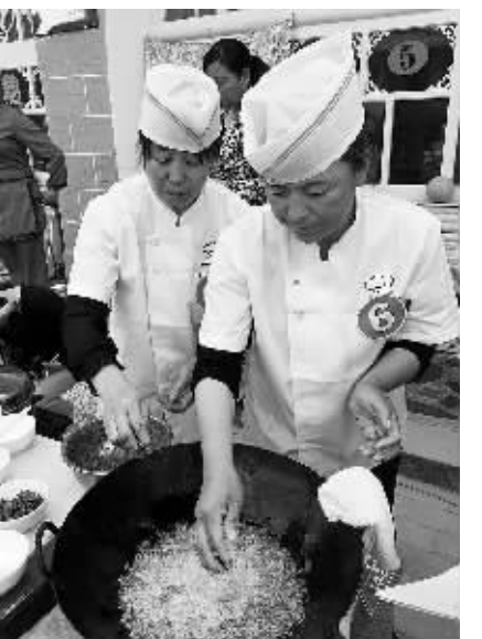
陕西延安市宝塔区首届“青年创业杯”农家乐厨艺大赛的参赛选手正在紧张烹制特色菜品。近年来，宝塔区以趣味厨艺竞赛为平台，引导农村青年依托优势产业创业。