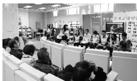
近日，志愿者在首都图书馆为盲人朋友朗诵经典话剧《雷雨》剧本。