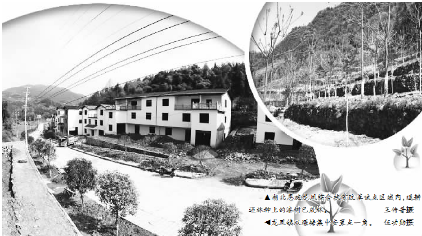
▲湖北恩施龙凤镇综合扶贫改革试点区域内，退耕还林种上的漆树已成林。 ▲龙凤镇双堰塘集中安置点一角。

为鼓励村民搬迁，当地政府出台的政策“含金量”颇高：选择搬迁的每人奖1万元，拆迁房屋每平方米补150元。加上其他奖励，每家补偿款在8万元左右，购房款缺口不大。如何让村民搬得了、留得住？政府也煞费苦心地与安置点附近的制鞋厂、茶叶