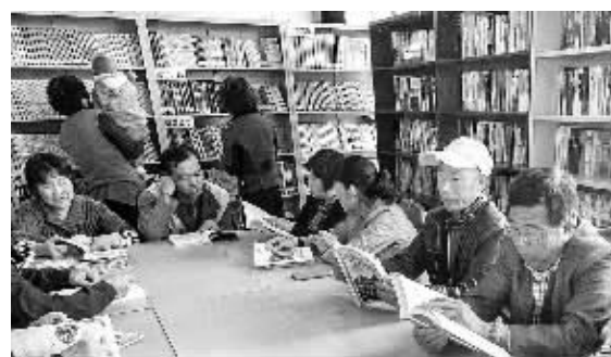
北京市通州区台湖镇前营村村民在村里的益民书屋读书看报。据介绍，这里已成为村民日常文化生活的重要组成部分，每天来此读书、借书的人络绎不绝。

今年以来，北京市组织了丰富多彩的主题阅读活动，通过开展新书展销、送书下乡、助盲有声阅读、向农民工及困难群众捐赠图书等活动，帮助特殊人群和困难群众进行阅读。全民阅读活动参与度和覆盖面不断扩大，“让阅读成为一种习惯”的理念深入人心，崇尚读书的社会风尚日益浓厚。