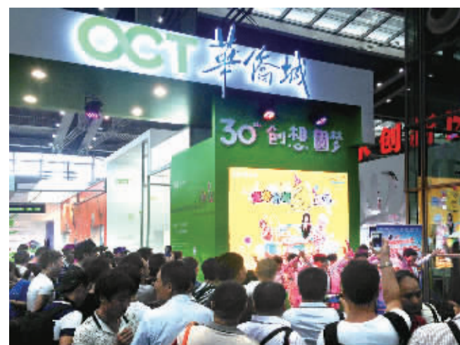
全国“文化企业30强”华侨城集团在第十一届文博会启动“全民梦想众筹行动”,搭建了全国首个互联网全民众筹梦想开发平台——“梦想种植园”,鼓励个人和集体提交公益梦想。图为华侨城参展现场吸引了众多观众参观。

放眼世界,世界一流城市靠什么获得了广泛的赞誉和影响力?经济基础固然重要,管理水平固然重要,但文化影响力无与伦比,“成为深圳城市文明的重要标志,最终决定城市影响力的是文化。”王京生说。 实施“文化立市”战略,深圳着力营造城市成熟而流动的文化氛围。“读书月”让爱读书成为这个城市的一大特色;“社科普及周”目前已连续举办12届,通过一系列知识性强、参与度高的活动,提升城市的文化品位、培育市民的人文素养;每年举办的“创意十二月”活动,10年来累计也有近600万市民参加……深圳正在用行动告诉人们:来吧,需要知识这里会给你知识,需要读书这里创造条件,需要展示空间这里会给你发展空间。 在不断的探索中,深圳找到了文化自信、文化自觉和文化自强,并让这种精神在整座城市激荡起来,形成了健康蓬勃的文化状态。如今,深圳的文化实践正在从自发走向自觉,并将在创新创业的大潮中,发挥不可替代的重要作用。 “文化创意产业是‘大众创业、万众创新’最好的舞台之一,也是最广阔的空间之一。”王京生告诉记者,“每个人每天都会新的想法,创意无大小,而它恰恰是文化产业发展的灵魂。”“文化+”的模式,可以使所有想创业创新的人都可以在文化产业中找到自己的机会,展现自己的才华。”