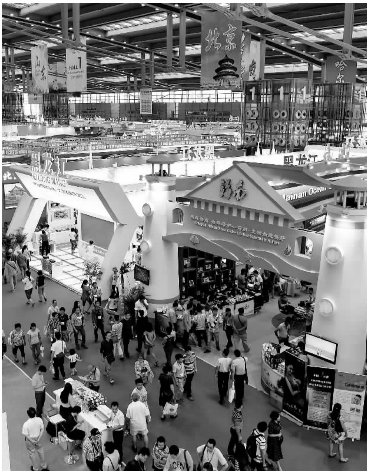
5月14日,第十一届中国(深圳)国际文化产业博览交易会现场。

公司拥有付费电视平台,境外卫星电视节目播控平台、中国电视长城平台、国际视频发稿平台、中视电视购物直播平台五大集控平台,形成了多元传播优势。