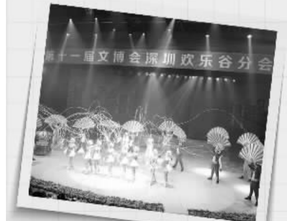
第十一届文博会深圳欢乐谷分会场开幕式表演。