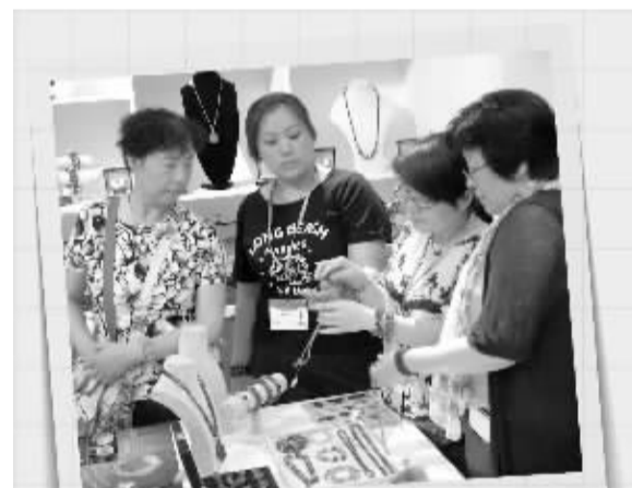
第十一届文博会山西馆内,工作人员向前来参观的嘉宾讲解商品的制作工艺。

北京万达文化产业集团有限公司是中国最大的文化企业集团,目前已进入电影院线、影视制作、影视产业园区、舞台演艺、电影科技娱乐、主题公园等多个行业。截至2014年,万达电影院线覆盖全国近百个城市,拥有已开业影院182家,银幕总数1616块;2014年票房总收入42亿元,占全国票房份额约15%。从2014年起,万达电影院线每年还将增加40家影城,计划到2016年开业达到260家影城。随着万达电影的不断发展壮大,万达电影院线打造电影终端连锁服务品牌的核心竞争力目标日益明确。