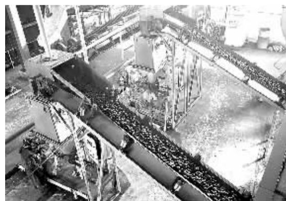
图为5月14日河北省霸州市15万吨洁净型煤生产线正在运转。据了解，与原煤散烧排放对比，洁净型煤的硫化物排放量减少70%以上，氮氧化物排放量减少50%以上，粉尘排放量减少80%以上。