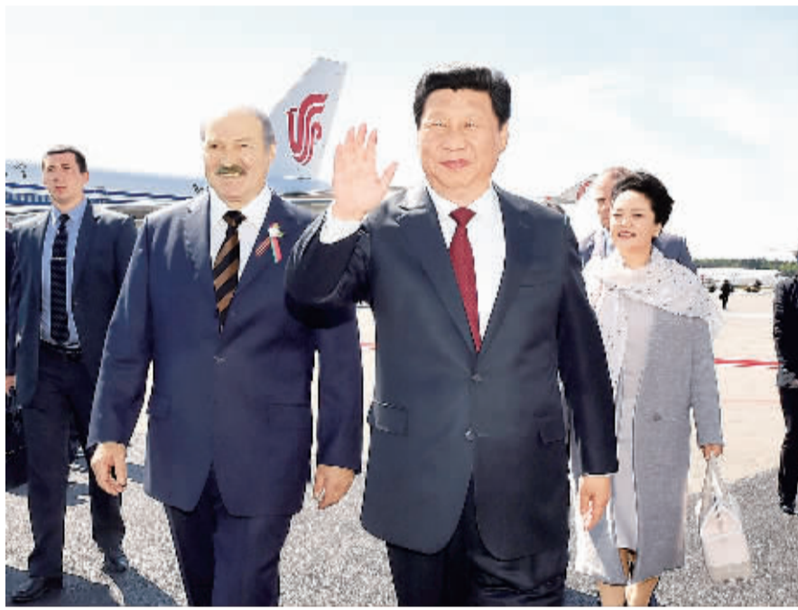
5月10日,国家主席习近平在明斯克同白俄罗斯总统卢卡申科举行会谈。