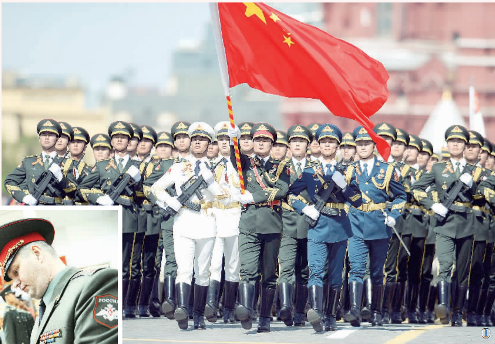
① 5月9日,在俄罗斯首都莫斯科红场,中国人民解放军三军仪仗队方阵行进在阅兵仪式上。俄罗斯9日在莫斯科举行盛大庆典,纪念卫国战争胜利70周年。