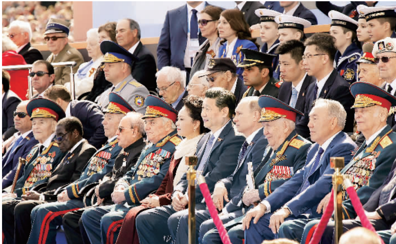
5月9日,俄罗斯举行纪念卫国战争胜利70周年盛大庆典。国家主席习近平和来自世界约20个国家和地区及国际组织领导人出席庆典。这是习近平和夫人彭丽媛同普京等领导人出席红场阅兵仪式。

5月9日是俄罗斯卫国战争胜利日。70年前,苏联军民经过浴血奋战,将德国法西斯侵略者赶出家园,并同其他国家军民一道乘胜追击,攻克柏林,取得了世界反法西斯战争欧洲战场的胜利。