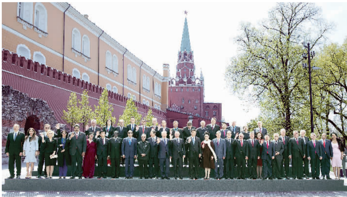
5月9日,俄罗斯举行纪念卫国战争胜利70周年盛大庆典。国家主席习近平和来自世界约20个国家和地区及国际组织领导人出席庆典。这是庆典结束后,各代表团团长夫妇集体合影。

5月9日,国家主席习近平出席俄罗斯纪念卫国战争胜利70周年庆典,传递了中国人民对俄罗斯人民在二战中建立的不朽功绩的崇高敬意,也彰显了中国愿与国际社会一道,同护和平、共促发展的决心与信心。