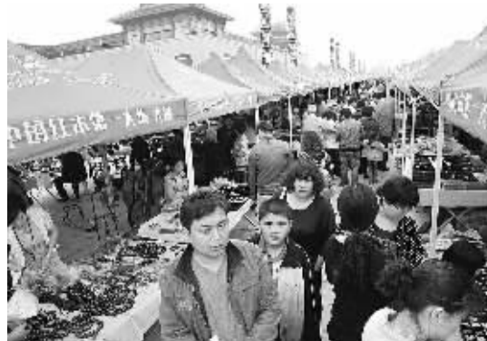
图为5月3日，顾客在河北省大城县的红木大集上“淘宝”。据介绍，目前，大城县红木家具生产企业达到103家，年产各类红木家具产品80万件(套)、产值60多亿元。