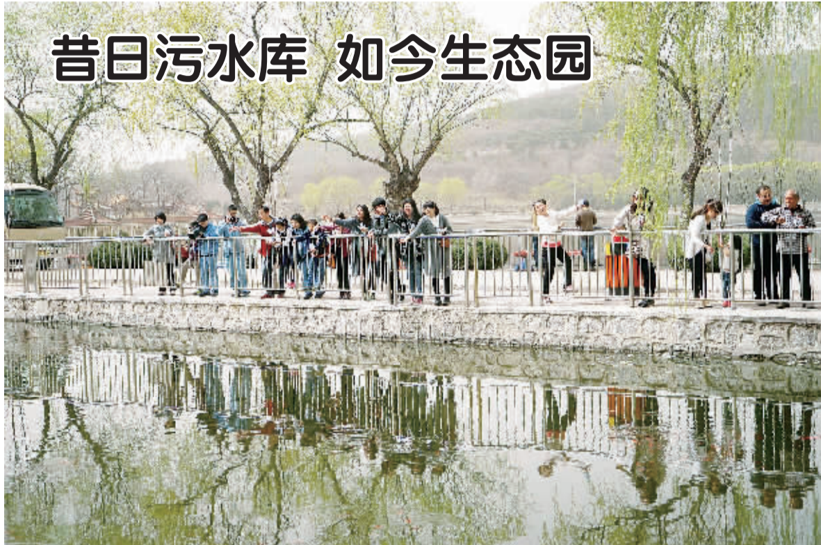
北京燕山石化牛口峪生态中心的水源主要来自燕山石化处理的工业废水和生活污水。近年来,当地加强环境保护工作,采取生化技术沉淀、过滤、净化水质,处理后的水质超过北京市II类水质标准。图为游客在生态园游览观光。

思路更为开阔的是“钱江源头第一县”开化。作为国家首批生态旅游示范区,开化2013年率先提出建设“国家东部公园”,统一规划乡村旅游资源,探索新常态下绿水青山转化为金山银山的变现机制。县委书记鲍秀英告诉记者,为了让绿水青山释放更大的生态红利,开化把全县分成3个区域:生态保护区、生态农林区和产城集聚区。“同样的山,同样的水,过去上山砍树、开石矿、办纸厂,结果变成‘穷山恶水’。如今,不去砍树去种树,不卖石头卖风景,美丽山水变成了美丽业态。”鲍秀英说。