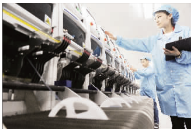
4月30日,中关村科技园区的北京利亚德光电股份有限公司,技术人员正在监控设备运行。依靠持续不断的自主研发和创新,该公司系列产品在国际高端市场深受欢迎。