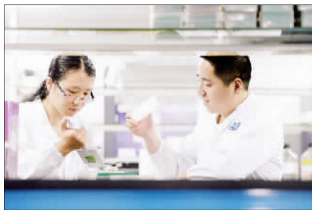
4月30日,北京市顺义区临空经济核心区华大基因有限公司,技术员正在做实验。该公司已形成科学、技术、产业相互促进的发展模式。