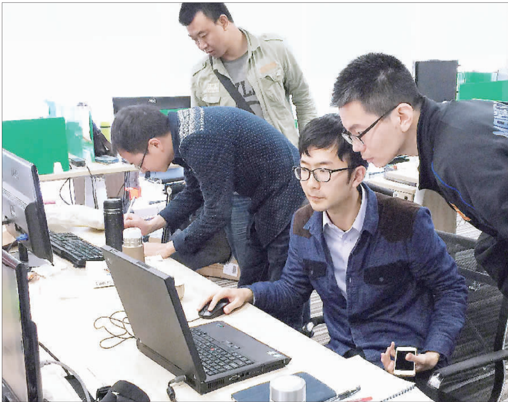
深圳南山智园为创客搭建平台,免费提供办公场所,并为对接产学研链条、寻找创业投资资金提供便利。年轻的创客们在这里尽情释放想象力,全情投入创新创业。

本报记者 张小影 赵晶 翟天雪 李树贵 牛瑾 李治国 李景录 通讯员 马九思摄影报道