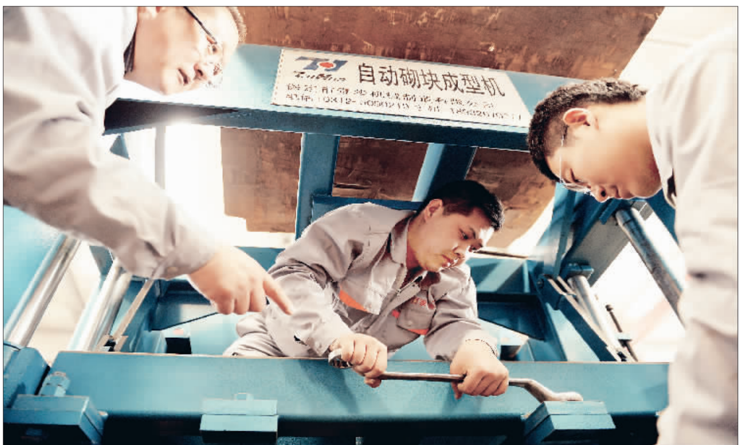
5月1日,河北保定市泰华机械制造有限公司员工正在安装调试设备。该公司坚持科技创新发展,取得了“悬挂式模板振动技术”、“储料仓斗门自动开闭系统”等6项国家专利。

对一个人来说,创新创业可以改变命运;对全社会来说,创新创业可以成就梦想。只要我们解放思想、放开手脚,让一切劳动、知识、技术、管理、资本的活力竞相迸发,就一定能激发出全民创新创业的动力与活力。