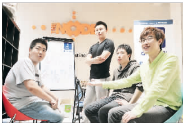
4月30日,北京极地国际创新中心,Diversity团队成员在“每日例会”上交流。具有同样的创业激情,5名“90后”大学生于去年底组成了创业团队,他们研发的语言社交软件即将上线。