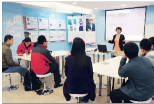
南开大学电子信息与光学工程学院成立的“创客空间”工作坊,创业导师在进行现场指导。该校目前每年拿出500万元经费用于专项支持学生创新和创业。

上海安翰医疗技术有限公司的工作人员在展示胶囊内镜机器人。这是世界上第一个主动控制胶囊内镜机器人系统技术,包含40多项专利,是我国在医疗器械领域的重大突破。