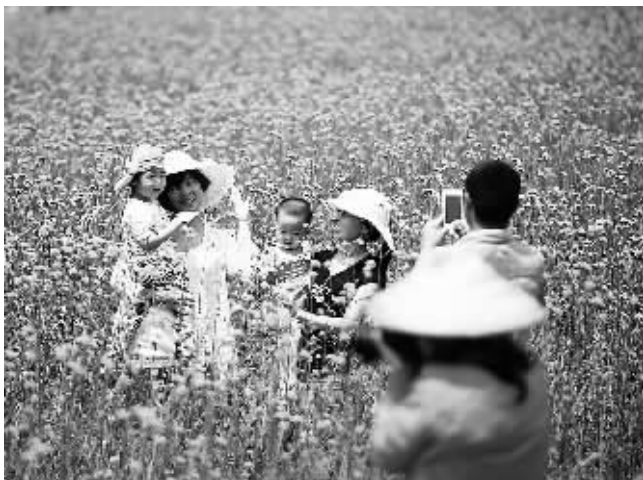
左图 5月1日，游客在古都开封的清明上河园景区内游览。当日是“五一”小长假的第一天，古都开封各景区游人如织，仅龙亭景区当日游客量就突破了1.5万人次。