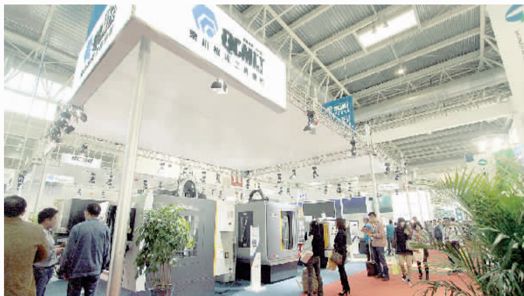
近日,第14届中国国际机床展览会在北京举办,众多海内外机床企业参展。