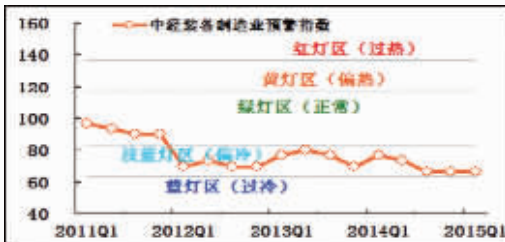
中经装备制造业预警灯号图