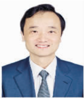
国家统计局中国经济景气监测中心 副主任 潘建成