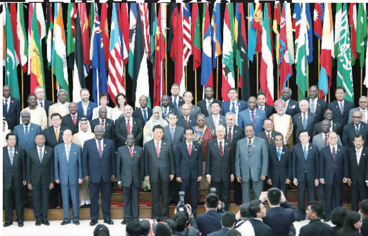
4月24日,在印度尼西亚参加亚非领导人会议的各国领导人来到万隆,纪念万隆会议召开60周年。这是中国国家主席习近平同与会领导人集体合影。