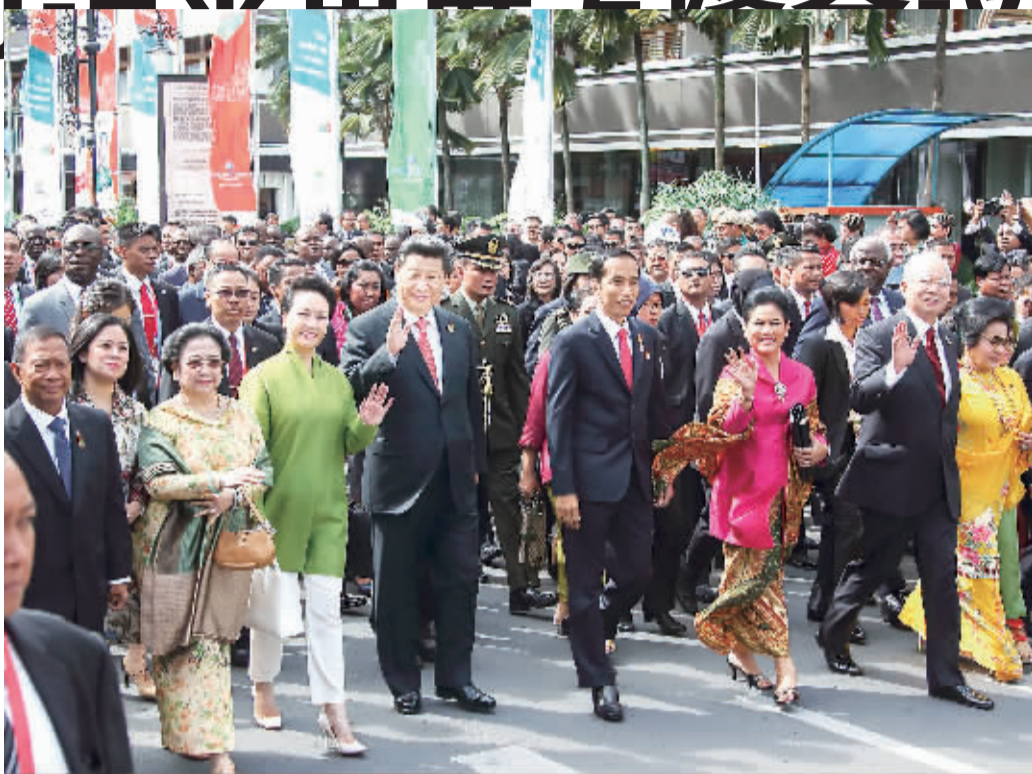
4月24日,在印度尼西亚参加亚非领导人会议的各国领导人来到万隆,纪念万隆会议召开60周年。中国国家主席习近平同来自亚洲、非洲和其他地区的国家领导人沿着亚非大街步行前往万隆会议旧址——独立大厦。这是习近平和夫人彭丽媛同印度尼西亚总统佐科夫妇等走在队伍前列,一边走一边向道路两旁的人群挥手致意。