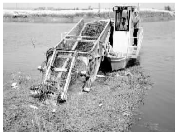
近日，江苏省兴化市戴南镇的许多河流开始用上自动化保洁船作业。为降低保洁人员劳动强度，该镇引导社会力量组建河道保洁公司，实行市场化运作。图为自动化保洁船正在作业。