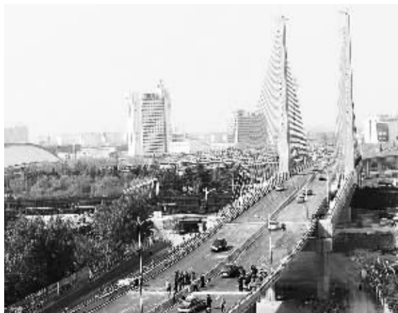
4月18日,山东邹城市三十米桥上跨铁路立交桥全线竣工通车。该桥的贯通,将使被京沪铁路分割的邹城市中心市区和兖矿集团所在的西部城区有机结合起来,从根本上解决每逢汛期强降雨天气,该市下穿铁路桥积水交通中断问题。

安徽省经济信息中心有关负责人介绍,在试运行的一个月时间内,各地、各部门和社会公众只需要登录安徽省电子政务大厅,就能轻松查看安徽省省级政府部门和试点市的权力清单、责任清单和涉企收费清单。试点单位政府权力事项的办事指南、办理流程、办结时限、所需材料等信息,也可以足不出户实现在线申报、在线查询办理结果。