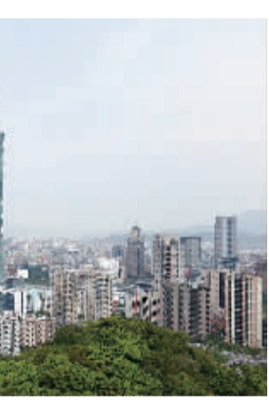
近年来,台湾吸引了越来越多的大陆游客。图为台北标志性建筑101大楼远景。