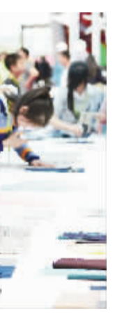
4月18日,第十八届海峡两岸纺织服装博览会在“中国休闲服装名城”福建石狮开幕。新华社发