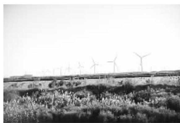
江苏省盐城东台市琼港镇东部的风电场，位于黄海之滨的沿海滩涂区域，东西宽1.5至5公里，南北长40公里，场区范围接近150平方公里，风光无限。

医药制造业持续保持去年良好势头，以生产具有自主知识产权的新药及抗肿瘤、心脑血管系统用药为主的企业，在政府开展服务企业转型升级的助推下，保持高速增长。海口市制药厂、海灵化学、奇力、齐鲁、皇隆、长安国际、康芝、普利、海神同洲等38家重点医药企业具品牌优势的拳头产品产销两旺。