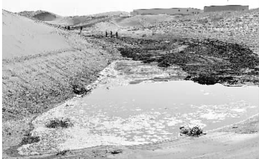
这是甘肃武威境内腾格里沙漠一处排污池,污染物由暗管直接排放至沙漠。目前,排污企业荣华公司董事长已被立案调查,两名直接责任人已被拘留,武威市、凉州区有关部门主要负责人已被停职并接受审查。

3月中旬,甘肃武威荣华工贸公司向沙漠排污事件引起社会广泛关注。受到污染的沙漠位于武威市城区以东23公里,当地称“八十里大沙”,沙漠多为固定沙丘。经无人机航拍和GPS定位,确定共有大小不等污水坑塘23处,污染面积266亩。排向沙漠的污染物主要是荣华公司通过2、3、4号泵站排出的生产废水,平时用于绿化沙漠公路两侧树木,由于冬季树木无需灌溉,则直接排往沙漠。