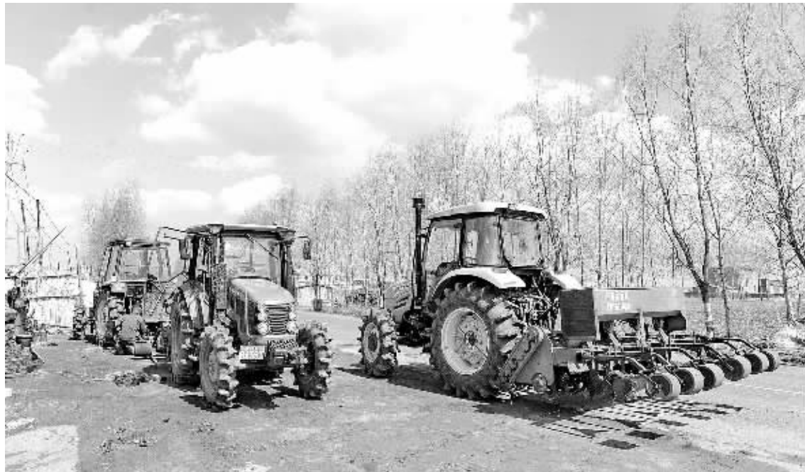
4月10日,吉林省长春市双阳区齐家镇,工人正在为农民检修农机。记者从吉林省农业委员会获悉,今年吉林全省计划投入备春耕资金213亿元,比上年增加2亿元,其中农民自筹130亿元,银行贷款83亿元,目前已到位95%。新华社记者 张楠摄

目前,墒情好于上年,利于适墒播种。4月1日至3日,内蒙古、辽宁、吉林以及黑龙江部分地区自西向东出现明显降雨过程,土壤墒情得到明显改善。截至目前,东北地区旱白地缺墒面积近2000万亩,比去年同期1.07亿亩减少8000多万亩。