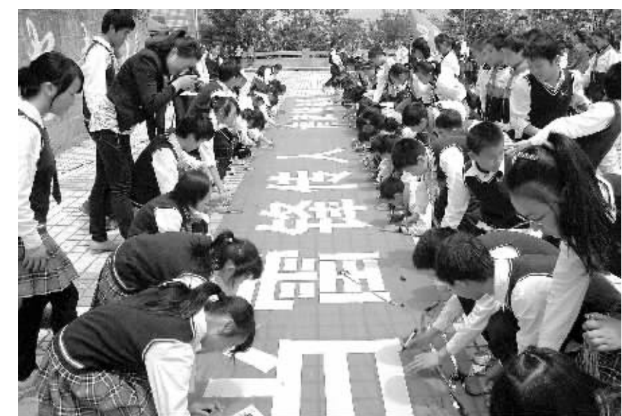
图为重庆万州区武陵镇举办的“当雷锋传人 谱武陵新篇”签字仪式现场。