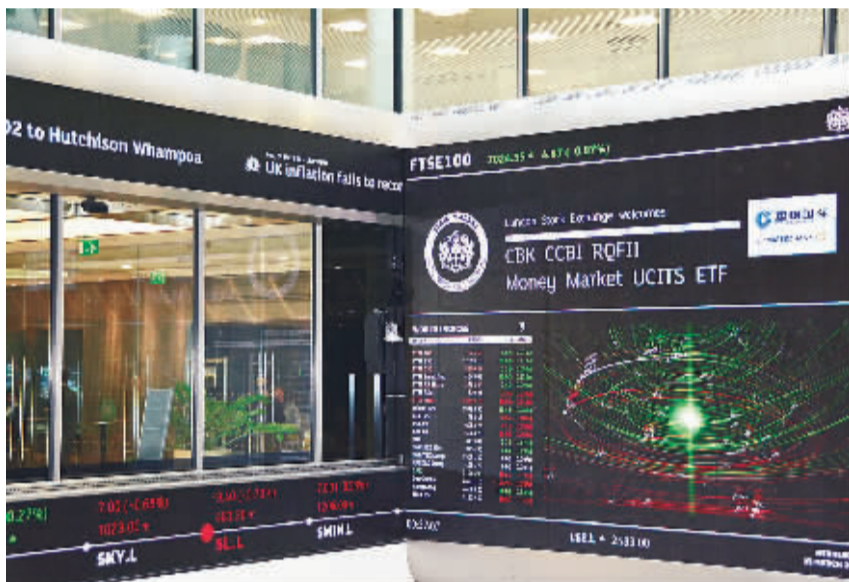
近日，建银国际资产管理公司在伦敦证券交易所发行亚洲市场之外第一只RQFII人民币货币市场ETF，为欧洲投资者进入中国银行间债券市场提供便利。

自2012年伦敦率先启动离岸人民币业务以来，3年来产品和服务和业务基础设施建设迅速发展。近期，英国连续采取措施解决其离岸人民币业务拓展面临的问题，以巩固其在离岸人民币业务方面的优势。 伦敦离岸人民币业务面临的挑战之一，是本地和欧洲市场投资者对人民币的接受和认可程度尚待提升。对此，英国政府和伦敦金融城利用多种方式向企业和投资者宣传推广离岸人民币市场产品和服务。同时，英国还借成为西方国家第一个申请加入亚投行一事，提升各方对人民币国际化的关注度和信心，从而巩固其离岸人民币业务。 曾力推英国离岸人民币业务的财政大臣奥斯本，是此次英国作出申请成为