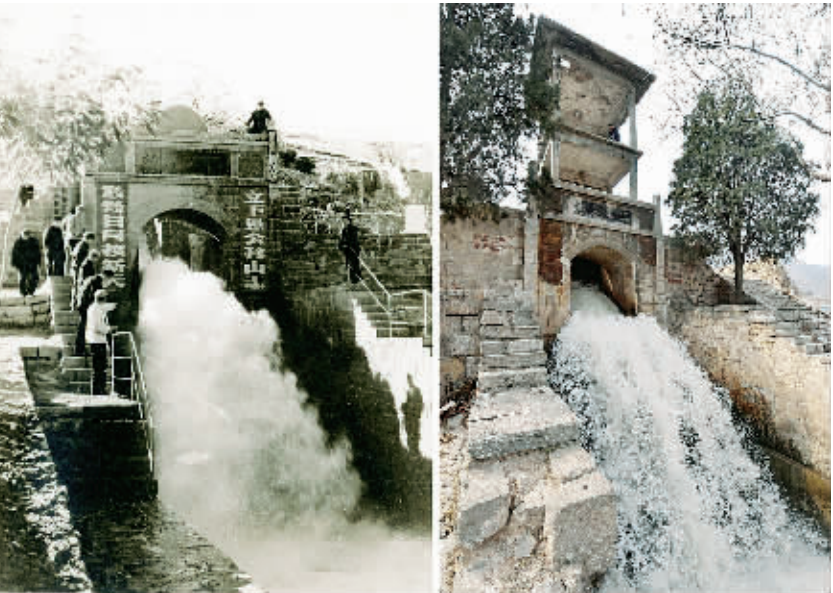
左图为红英汇流的历史资料照片。红英汇流位于合涧镇西，红旗渠第一干渠在此与1958年修建的英雄渠相汇。 右图为3月23日拍摄的红英汇流。

它的建成，结束了千百年来林州人民吃水难的苦难历史。有关统计资料显示，红旗渠通水50年来，共引水约125亿立方米，农业供水约70亿立方米，累计灌溉农田超过4600万亩，增产粮食17亿公斤，发电近8亿千瓦时，有力地促进了林州市经济社会的健康快速发展。