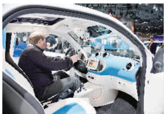
2015纽约国际车展日前开幕。图为一名观众在纽约车展上体验新款SMART车型。

新首都的具体地址可能是在开罗的东面,位于苏伊士运河和埃因苏赫纳公路之间。建成后,所有政府机关和外国驻埃使馆均将搬至新首都。埃及住房部部长表示,新首都建设预计将花费450亿美元。此外,埃及政府还计划修建一个比伦敦希思罗更大的国际机场,以及太阳能农场、4万间酒店、将近2000所学校、18家医院,以及至少6000英里(9656公里)的公路。