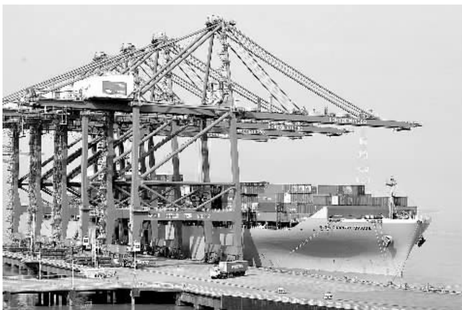
上图 1月18日,一艘货轮在浙江宁波港北仑穿山港区进行集装箱装卸作业。2014年宁波港口开发东盟、南亚等“21世纪海上丝绸之路”新航线,目前集装箱航线总数保持在228条。