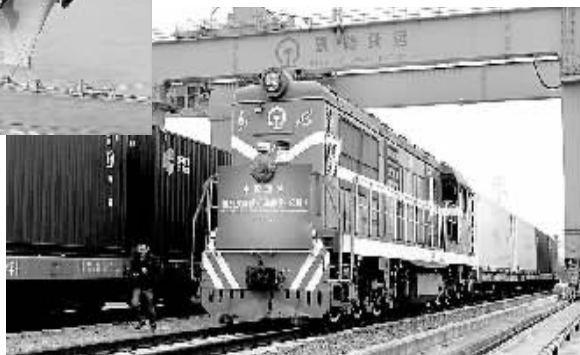
下图 2月22日,首趟“义新欧”中欧班列抵达浙江义乌。这是“义新欧”国际铁路联运大通道运行以来的首趟回程班列。