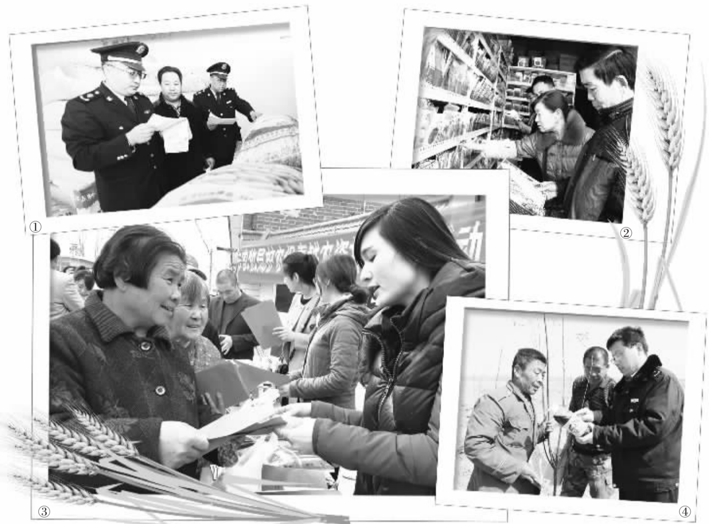
①春耕时节,河北省固安县工商局成立综合执法队,组织开展农资专项检查。 ②四川省广元市朝天区积极做好农资筹备调运,确保货源充足,价格平稳。 ③3月24日,河北省迁安市深入组织开展春季护农保春耕农资打假专项行动。 ④3月25日,山东省阳信县工商人员走进田间地头,为农民讲解辨别真假农药的知识。