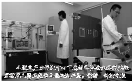
小榄生产力促进中心下属的电器安全规范实验室技术人员正在为企业检测产品。黄标 钟裕敬摄