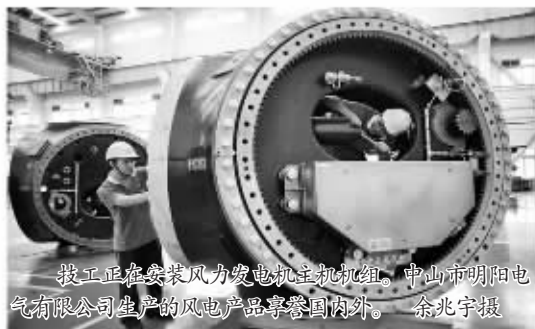
技工正在安装风力发电机机舱罩,中山市明阳电气有限公司生产的风电产品享誉国内外。