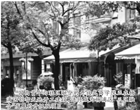
国内首个与园区融合的开放式商学院正在杨浦区创智天地开工建设，这将成为杨浦区“三区融合”发展的升级版项目。

未来，以五角场区域为重点，杨浦将进一步凸显“大五角场中央智力区”概念，进一步汇聚人才、知识、科技、资金，串联起五角场商圈、创智天地、复旦创新走廊、湾谷科技园、公共实训基地、环同济知识经济圈等重点项目，促进创新、产业、人才等资源充分整合，通过空间功能再设计和发展环境再提升，助推杨浦实现新跨越。