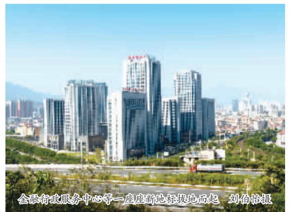
金融行政服务中心等一批新地标拔地而起

今日安溪,既有青山绿水,青翠茶田,更有生态工业的相得益彰。安溪从后发山区跃升为全国百强和高新技术产业高地,得益于思想的解放、观念的更新、理念的创新和精准的运作。明天的安溪,将是一个环境美、百姓富、县域强的新典范。