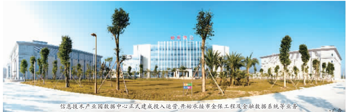
信息技术产业园数据中心正式建成投入运营,开始承接市金保工程及金融数据系统等业务