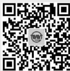
扫描二维码,关注武钢官方微信:幸福武钢

建立完善长效机制,建设推进“幸福武钢”。武钢领导班子50条整改措施、7个专项整治全部落实,建立完善7个长效机制;机关部门和37家直属单位整改措施完成率98.8%,建立健全200个作风建设长效机制,职工群众反映的一些突出问题得到解决。深入推进全员自主创新,创建373个职工创新工作室,有效激发职工工作积极性和创造性,取得一批创新成果,其中2项成果在第九届海峡两岸职工创新成果展上获金奖。