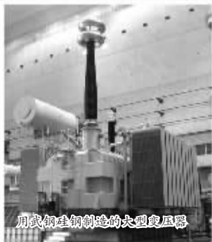
用武钢生铁制造的汽轮机