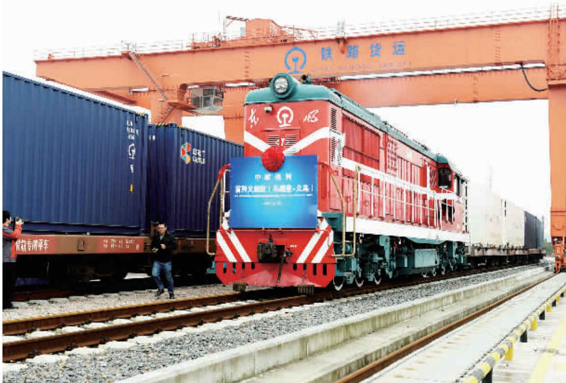
2月22日,首趟“义新欧”中欧班列抵达浙江义乌。