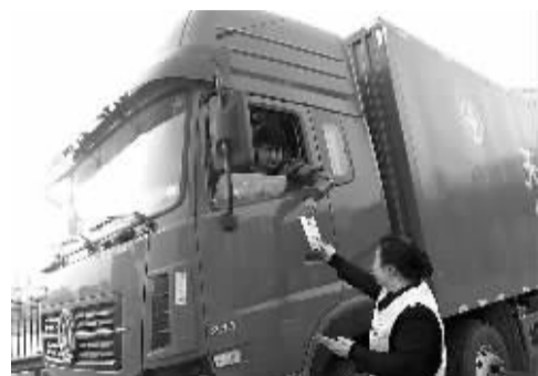
有啥不懂问我们,送份地图送便捷。