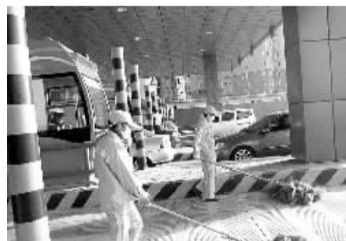
一次扫20个车道,一天扫三四遍,春节更是随时待命。所以,请不要乱扔垃圾哦。