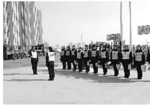
看,英姿飒爽的交接班,新的一天开始了。

过年了,旅客急匆匆奔赴四面八方。咸阳收费站的工作人员坚守着自己的岗位,希望这些默默的付出,能够温暖每一个人的回家之路!