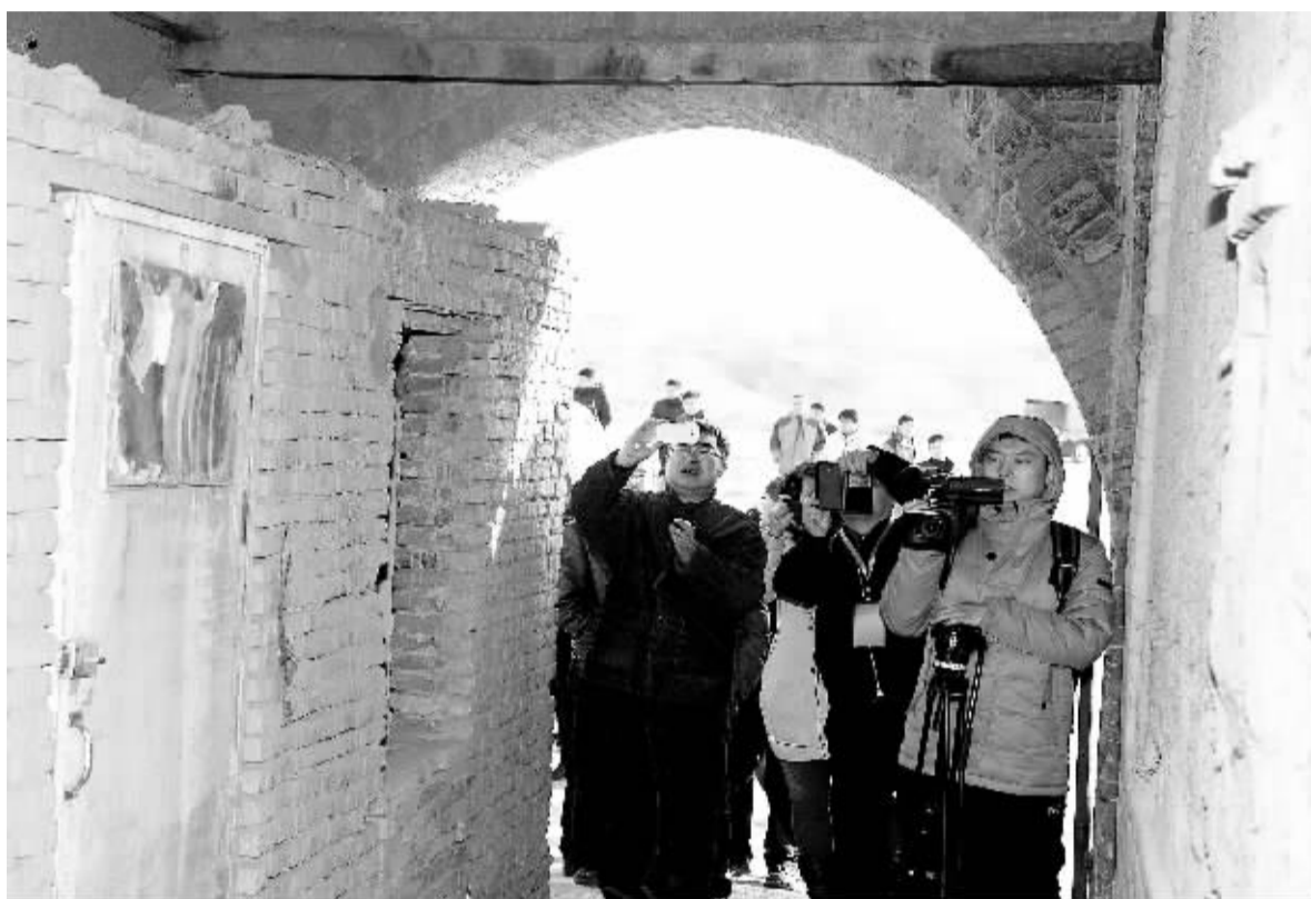
图为参加全国棚户区改造经验交流会的各方代表在内蒙古包头市东河区北梁棚改现场实地走访调研。正是在该次会议上，住房和城乡建设部提出，应大力推进棚户区改造的货币化安置。

根据住建部不久前的表态，未来一段时间，棚户区改造仍将是各级政府的重点工作。在推进棚改的过程中，不仅可以为拆迁居民建设定向实物安置的房源，也可以实行货币化安置，也能立即将安置补偿款发放到居民手中，让他们根据自己的需要到市场上购买新建商品房或二手房。记者实地调查发现，推行棚改货币化安置受到社会各方普遍好评——