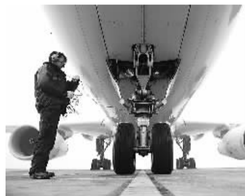
飞机起飞前,北京首都国际机场工作人员正对机身状况进行细致检查。