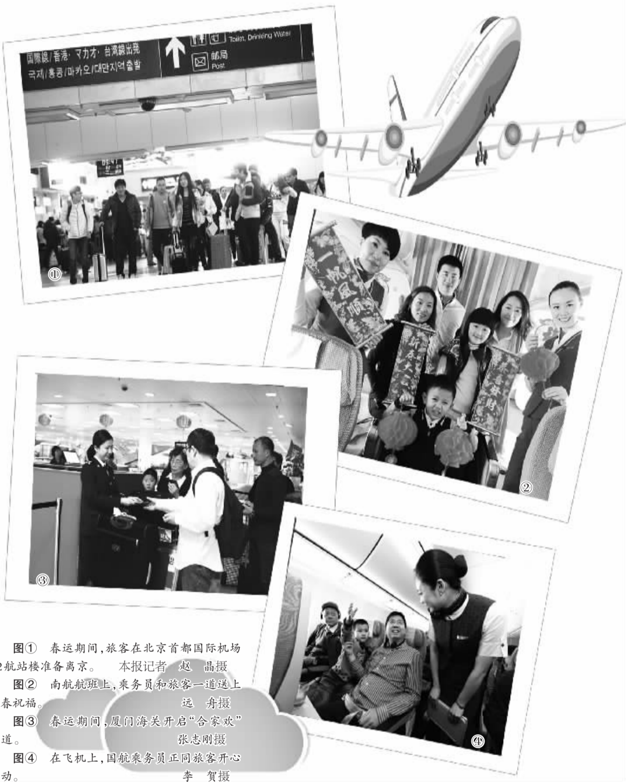
图① 春运期间,旅客在北京首都国际机场T2航站楼准备离京。

据国航相关负责人介绍,国航电子商务渠道针对预订春运期间机票的旅客推出了多种超值优惠产品,如“中国年春节机票100元起”等。与此同时,通过国航电商渠道,旅客还可享受如机票预订、掌上值机、付费选座、行李提取、里程累积等多项升级服务。