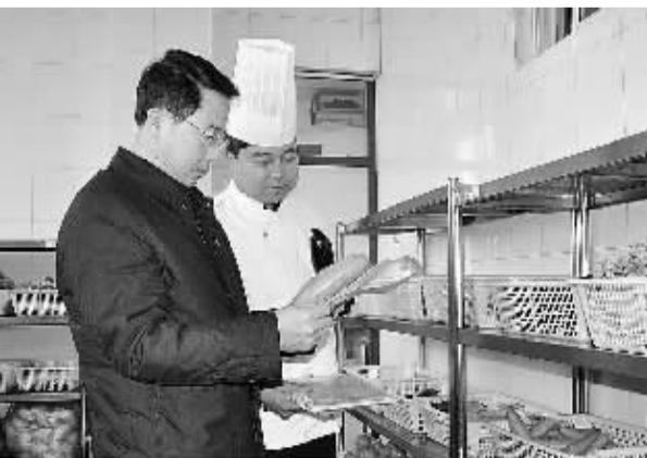
盘锦市高级中学食堂管理人员认真验收配送中心送来的食材。

目前，盘锦市学校食堂食材配送工作形成了科学、高效、合理、规范的配送流程，建立完善了一系列有法可依、现实可用的管理制度，全市学校食堂食材配送工作已步入良性运行轨道。