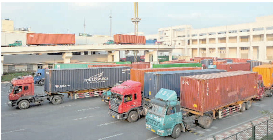
满载出口商品的集装箱车队在浙江省“大通关”项目——义乌市内陆口岸站等候验关(2014年9月26日摄)。

《方案》提出,要在优化机制的基础上,完善大通关管理体制的渐进改革措施,研究探索行政执法权相对集中行使和跨部门联合执法;开展查验机制创新和综合执法试点等改革措施。