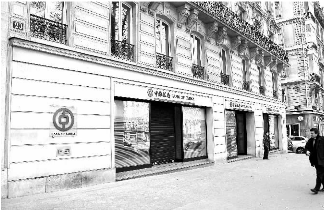
中国银行已经在法国巴黎启动了人民币清算和结算业务。图为中国银行巴黎分行外景。

日前,中国人民银行与瑞士国家银行(瑞士央行)签署合作备忘录,就在瑞士建立人民币清算安排有关事宜达成一致,并同意将人民币合格境外机构投资者(RQFII)试点地区扩大到瑞士,投资额度为500亿元人民币。这是中国在海外建立人民币清算安排的又一布局。尽管人民币国际化是一个长期过程,但随着一步步具体措施的落实,人民币融入世界的步伐将更加坚实、更加稳健