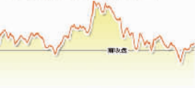
1月23日上证综指走势图