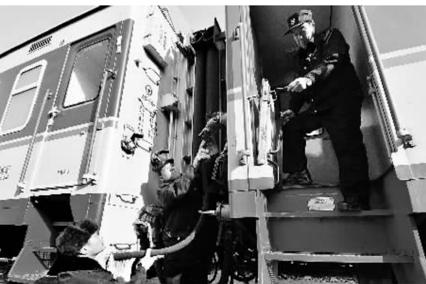
1月22日,天津动车客车站的职工对临客车辆进行通信连接线缆挂挂作业。

此外,“随着新能源汽车销量激增,新能源汽车的金融、租赁、保险、维修等后市场服务将逐步形成。新型锂离子电池、超级电容器、金属空气电池,以及碳纤维车身、新型高效电机等技术在研发和产业化方面将进一步取得重大进展。”王鹏说。