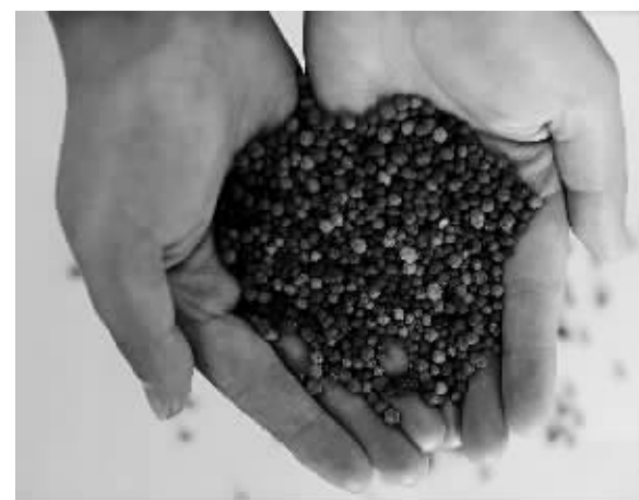
1月16日,沈阳农业大学辽宁岫岩产学研基地一名工作人员在展示生物炭基马铃薯专用肥样本。日前,沈阳农业大学研发的组合式多联产生物质快速炭化设备及其制炭方法获得国家专利。

农业部专家认为,齐河县的两项地方性综合标准的制定在全国尚属首创,值得各地借鉴。这两个综合标准涵盖了小麦、玉米大面积高产创建的主要环节,为进一步规范质量安全生产、农业社会化服务奠定了坚实基础,有利于提高农田综合生产能力,培育发展新型生产主体和多元服务主体,促进政府购买公益性服务。