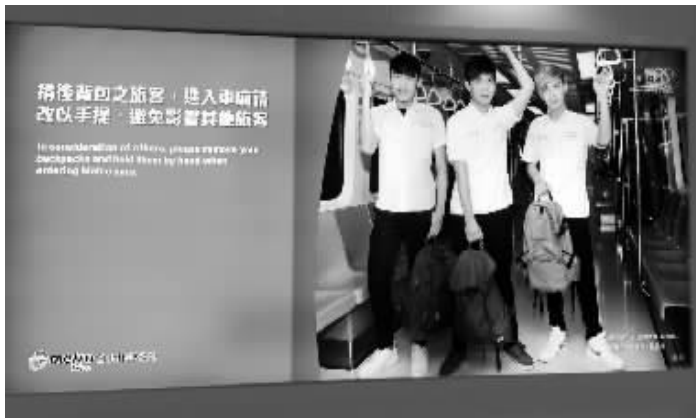
图①为台北街头的敬老广告。图②、图③为台湾地铁里的乘车提示广告。