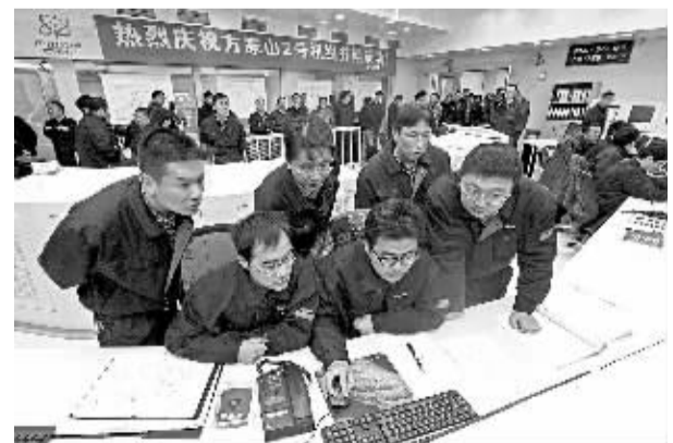
1月12日,在泰山核电站扩建项目方家山核工程2号机组主控室,操纵员在监测核电机组运行状况。