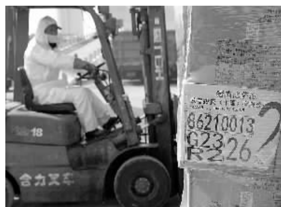
1月4日,上海动物无害化处理中心的工作人员在搬运准备销毁的福喜问题食品。当日,最后一批1415箱上海福喜生产并召回的问题食品在上海动物无害化处理中心销毁完毕。