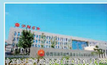
中石油天然气运输公司北京指挥调度中心