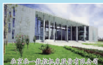
北京北一数控机床股份有限公司