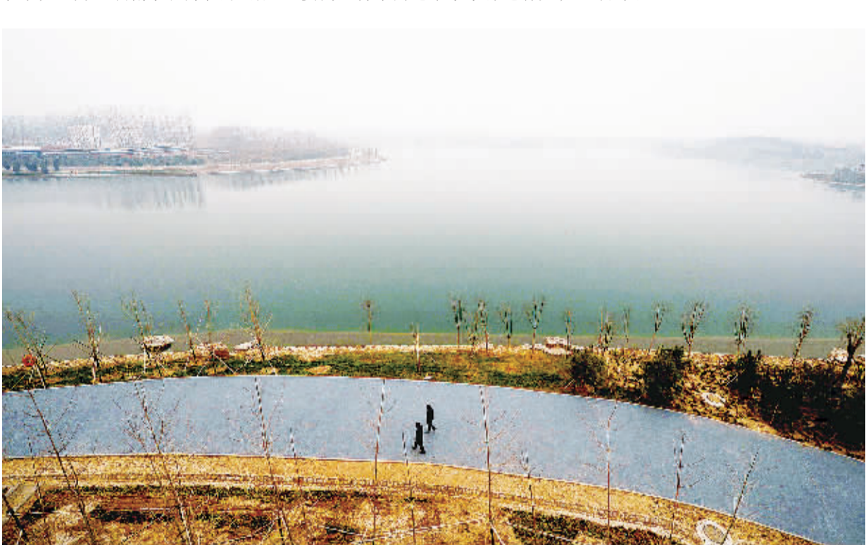
这是南水北调配套工程北京团城湖调节池。12月27日,“南水”将正式进京。团城湖调节池连接北京密云水库和南水北调两大水源,可将江水配送至各水厂,也可将江水补充至密云水库。

北京市南水北调办主任孙国升表示,12月12日南水北调中线一期工程正式开闸通水,按照水头行进速度,预计27日到达北京团城湖明渠广场。目前,北京参与接水的首批项目已全部投入运行。 怎样用好这些水?“核心是做好‘喝、存、补’工作。”孙国升表示,“喝”是指优先使用“南水”作为自来水厂水源。“存”是指激活现有工程设施,将来水存入密云水库等已建水利工程设施。“补”是指主要向运行中的地下水水源地补充,使城市地下水源地处于热备份状态。