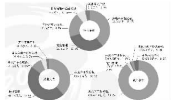
图3-5 按行业分组的房地产业结构