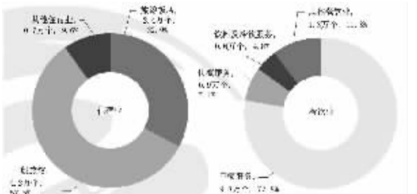
图3-3 按行业分组的住宿和餐饮业企业法人单位结构

在住宿和餐饮业企业法人单位中，内资企业占97.8%，港、澳、台商投资企业占1.1%，外商投资企业