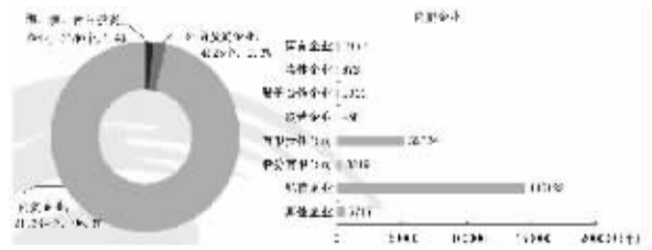
图3-4 按登记注册类型分组的的信息传输、软件和信息技术服务业企业法人单位及结构