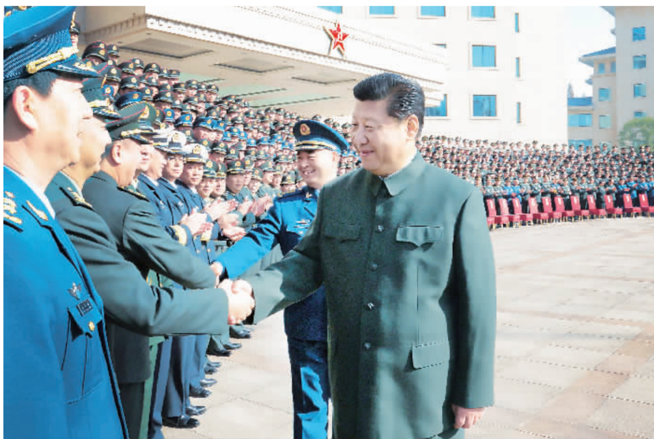
12月14日,中共中央总书记、国家主席、中央军委主席习近平来到南京军区机关视察。这是习近平接见驻宁部队师以上领导干部和南京军区机关团以上领导干部。

政治、组织、作风上彻底肃清徐才厚案件的恶劣影响。要以徐才厚、谷俊山案件为反面教材开展警示教育,使各级干部特别是高级干部受警醒、明底线、知敬畏,切实引以为戒。要把铸牢军魂抓得紧而又紧,确保部队在任何时候任何情况下都坚决听从党中央、中央军委指挥。要打造强军文化,巩固部队思想文化阵地,坚定官兵革命意志、升华官兵思想境界、纯洁官兵道德情操,引导他们努力成长为有灵魂、有本事、有血性、有品德的新一代革命军人。