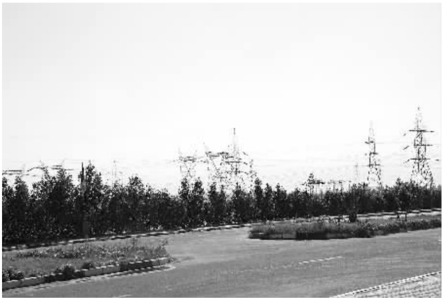
图为埃及首都开罗郊区的输电网。

不久前,埃及遭遇大面积停电风波,致使各家各户都准备应急灯,一些咖啡馆、酒店和高级公寓甚至装配了发电机。满足民众用电需求成了埃及政府亟待解决的课题。据悉,停电主因是发电站负担过重和天然气短缺。 埃及拥有丰富的天然气资源,但埃及天然气产业的发展却远不能满足日益增长的本地需求和出口承诺。这不仅影响到国民消费,能源密集型产业也深受其害。区域投资银行EFG-Hermes研发总监艾哈迈德·山姆斯·艾丁指出,过去3年,埃及国内天然气消费量的年增长率达到10%,2012年为550亿立方米,而天然气产量却一直在600亿立方米左右徘徊。2011年以前,埃及天然气出口量保持在160亿立方米,此后埃及政府为保证国内需求,削减了出口量。