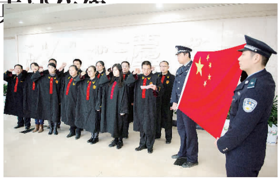
12月3日,合肥市蜀山区法院的新任法官向宪法宣誓,承诺忠诚履职。2014年11月1日,十二届全国人大常委会第十一次会议审议通过关于设立国家宪法日的决定,明确将12月4日设立为国家宪法日,国家通过多种形式开展宪法宣传教育活动。

“一天,我们迎来了一个平凡而伟大的日子,这一天,建设法治中国进程中具有特殊纪念意义的日子,更是全社会共同维护宪法地位的“教育日”、“普及日”、“信仰日”和“行动日”。伴随多种形式的宪法宣传教育活动在各地各领域扎实开展,必将进一步凸显宪法“统帅”地位,传递我们党依宪治国、依宪执政理念,增强全社会的宪法意识,推进依法治国。宪法是国家的根本法,是治国安邦的总章程,是党和人民意志的集中体现,具有最高的法律地位、法律权威、法律效力。回望我国宪法制度的发展历程可见,宪法与国家前途、人民命运息息相关。维护宪法权威,就是维护党和人民共同意志的权威;捍卫宪法尊严,就是捍卫党和人民共同意志的尊严;保证宪法实施,就是保证人民根本利益的实现。党的十八届四中全会明确提出,坚持依法治国首先要坚持依宪治国,坚持依法执政首先要坚持依宪执政。这是对宪法地位、作用及重要性的高度概括。完善以宪法为核心的中国特色社会主义法律体系,加强宪法实施,是全面推进依法治国的重大任务之一。需要看到的是,当前宪法在实施中仍面临一些挑战。例如,保证宪法实施的监督机制和具体制度还不健全,有法不依、执法不严、违法不究现象在一些地方和部门依然存在;公民包括一些领导干部的宪法意识还有待进一步提高等。通过设立国家宪法日加强宪法宣传,正是为了解决这些现实问题,弘扬宪法精神、树立宪法权威、加强宪法实施而作出的重要部署。宪法的根基在于人民发自内心的拥护,宪法的伟力在于人民出自真诚的信仰。只有让宪法走进人民群众,宪法实施才能真正成为全体人民的自觉行动。设立“国家宪法日”,通过开展各种参观、纪念和宣传活动,让大家亲身接触宪法,有利于在抽象的宪法文本与具体的权利自由之间搭建感性联系,形成举国上下尊崇宪法、宪法至上、用宪法维护人民权益的社会氛围,使宪法观念和宪法体现的基本精神更加深入人心。让宪法真正在老百姓心中“热”起来,在社会生活中“活”起来,仅靠一年一度的国家宪法日显然不够,还需要更多的载体与制度建设,在日常实施中显示宪法的生命与权威。为此,既要坚持国家一切权力属于人民的宪法理念,最广泛地动员和组织人民依照宪法和法律规定行使国家权力,也要以宪法为最高法律规范,维护社会主义法制的统一和尊严;既要坚持人民主体地位,切实保障公民享有权利和履行义务,也要坚持党的领导,更加注重改进党的领导方式和执政方式。通过每年365天坚持不懈抓好宪法实施工作,把全面贯彻实施宪法提高到一个新水平。(相关报道见十一版)